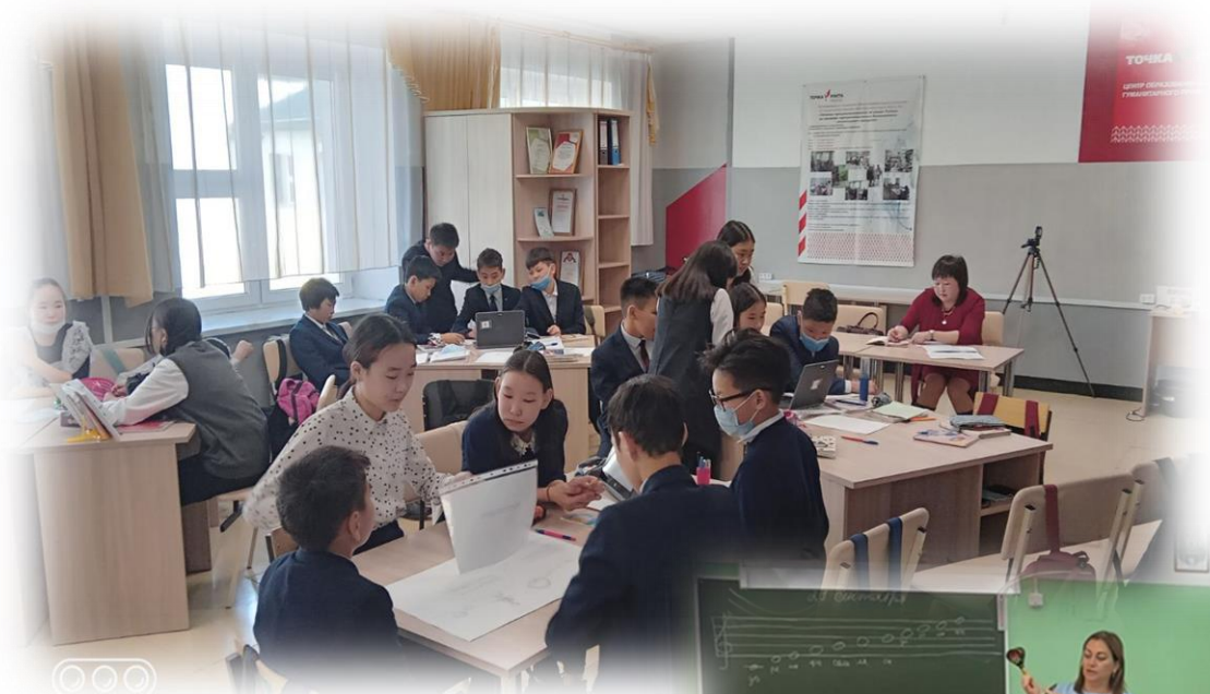
Посещение уроков по расписанию