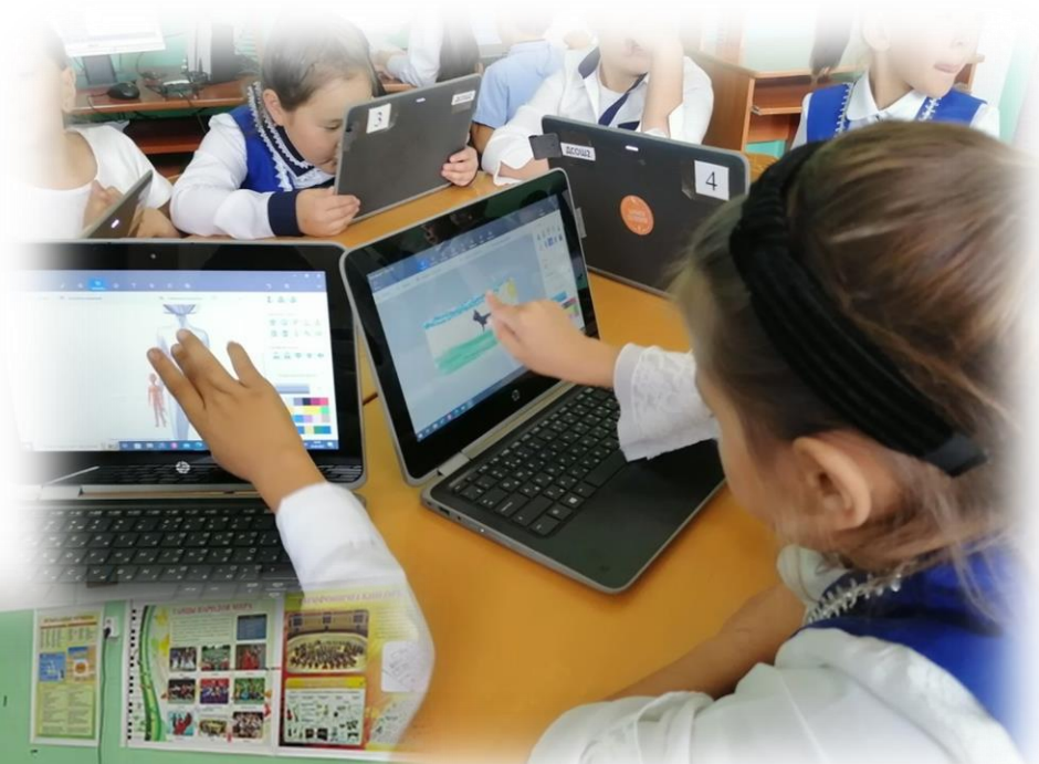
ПРОкачка цифровых компетенций в «Точке роста»