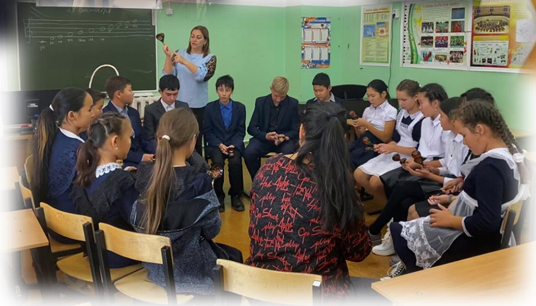
Посещение кружков и секций