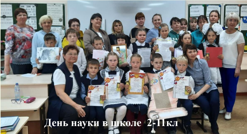
День науки в школе 2-11кл