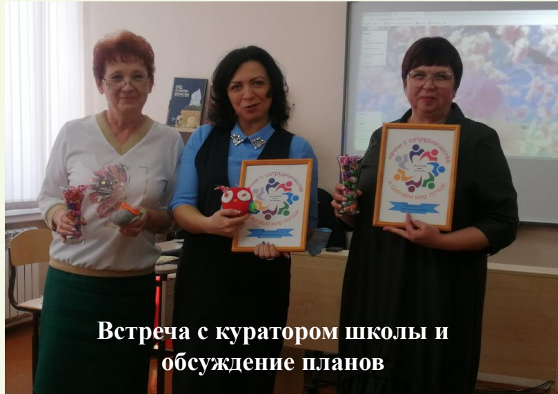
Встреча с куратором школы и обсуждение планов