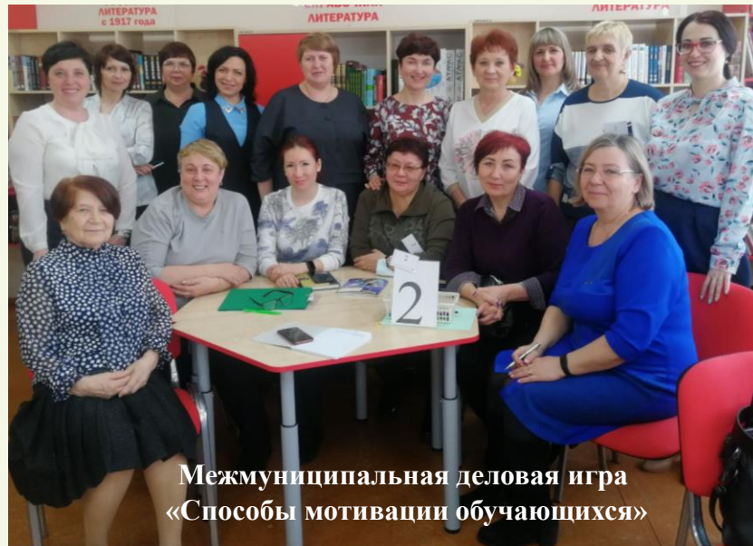
Межмуниципальная деловая игра «Способы мотивации обучающихся»