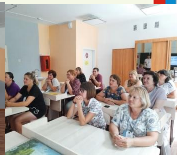
Региональная летняя методическая школа педагогов Усольского района на базе школы